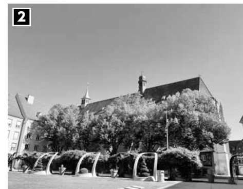
Eglise protestante St-Matthieu

(オープニングフェスティバル・カクテルレセプション 展示・実演・ワークショップ)