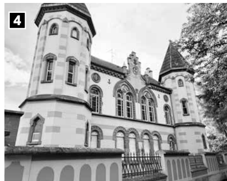
Cercle Catholique Saint-Martin